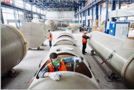
Производство г. Тольятти