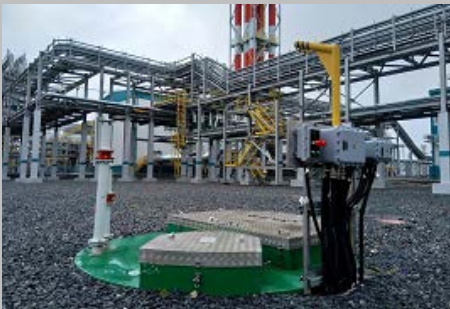
Производство и поставка 30-и комплектных КНС ПАО "СИБУР Холдинг" Западно- Сибирский Нефтехимический комбинат Г. Тобольск